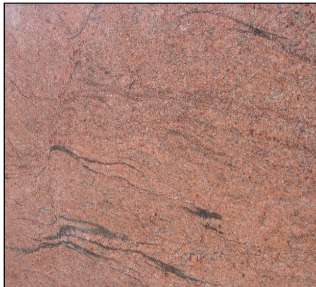
La photo est indicatif, la couleur et la structure peut dévier.

Caractéristiques: des nuances de teinte sont toujours plus ou moins présentes dans cette matière, même dans un lot identique. Le Multicolor Red est plus sensible que les autres granites à l'humidité ascensionnelle, avec risque de gauchir.