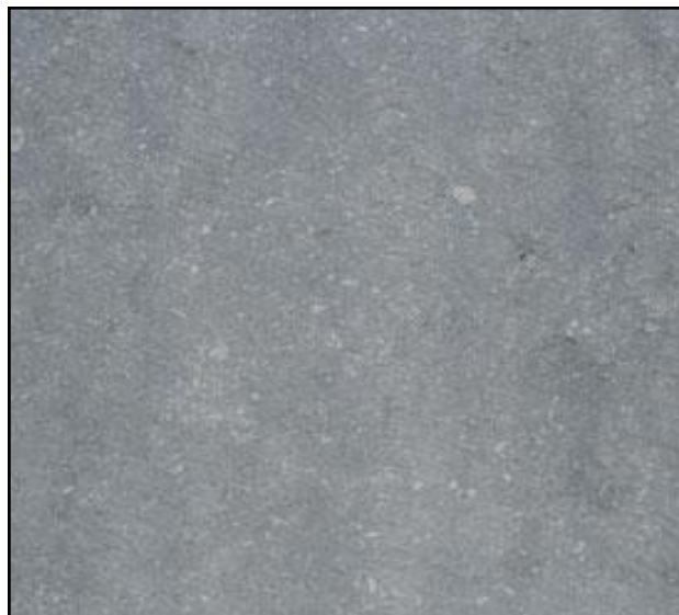
La photo est indicatif, la couleur et la structure peut dévier.

Caractéristiques: des nuances de teinte sont toujours plus ou moins présentes dans cette matière, même dans un lot identique. La formation géologique des roches sédimentaires est responsable de la présence des veines stylolitiques. Il s'agit d'un phénomène propre à la structure même de ce matériau qui n'aura aucune conséquence dommageable sur la durabilité de la pierre. Il ne peut donner lieu à aucune plainte