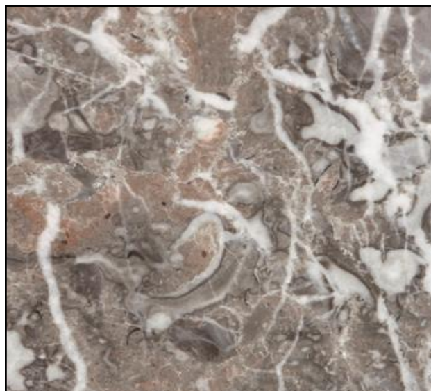
La photo est indicatif, la couleur et la structure peut dévier.

Caractéristiques: des nuances de teinte sont toujours plus ou moins présentes dans cette matière, même dans un lot identique.