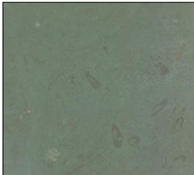
La photo est indicatif, la couleur et la structure peut dévier.

Le Dolomit Vert est très poreux et sensible à l'humidité (formation de taches type I, voir NIT 213 du CSTC).