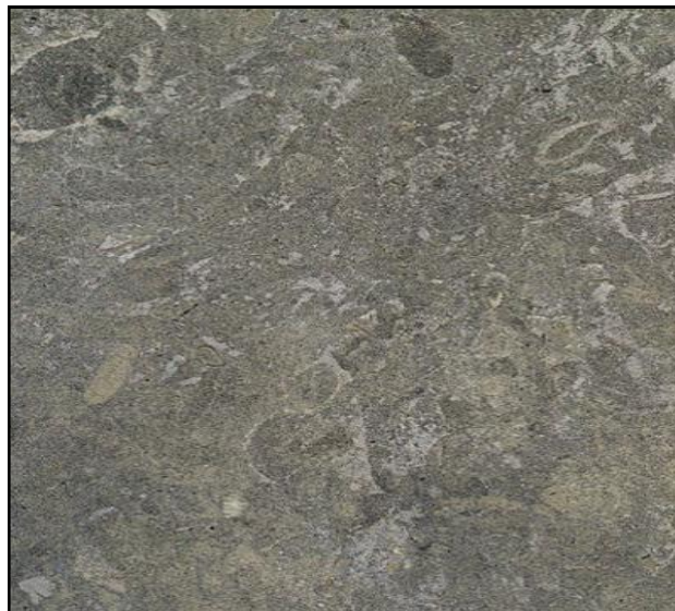
La photo est indicatif, la couleur et la structure peut dévier.

Caractéristiques: des nuances de couleurs sont toujours plus ou moins présentes dans cette matière, même dans un lot identique. Quelques fossiles plus ou moins arrondis et plus rugueux, qualifiés par les non-professionnels de taches de ciment, peuvent parfois se présenter dans cette matière. C'est une caractéristique intrinsèque de l'Azul Valverde qui ne peut en aucun cas donner lieu à des réclamations. Cette pierre naturelle contient également des veines stylolithiques qui s'évideront, à cause de sa sensibilité à l'humidité, après quelque temps. Le phénomène est inhérent à la structure de cette matière et n'a aucune conséquence sur la durabilité de la pierre.